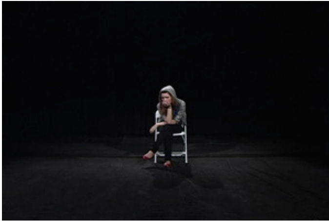
Genre: Ado, 32 minutes in loop.