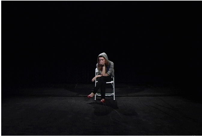
Genre: Ado, 32 minutes en boucle.